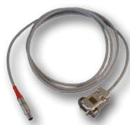
Kabel komunikační SCANLIGHT